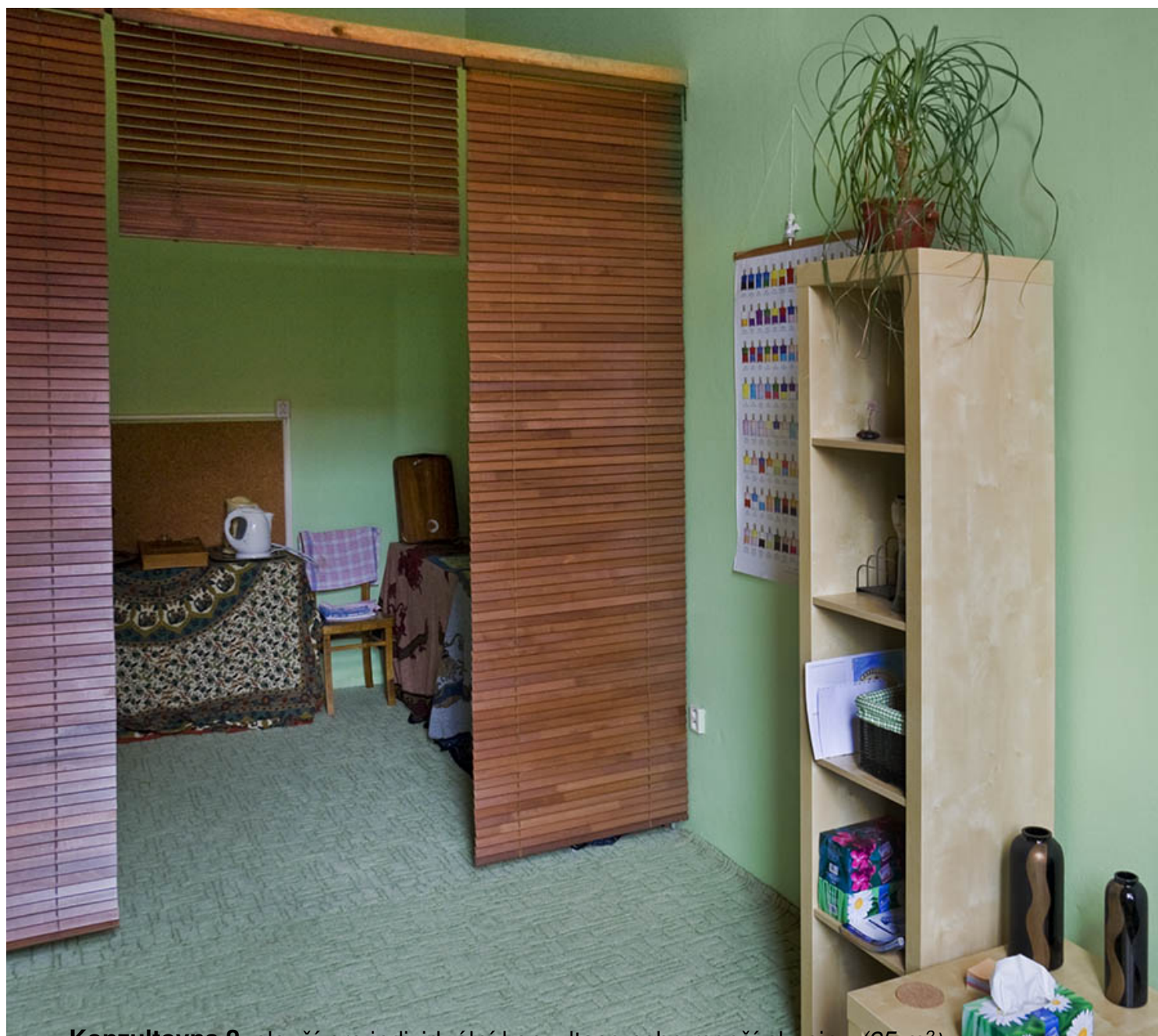
- Konzultovna 2. slouží pro individuální konzultace nebo menší skupiny (25 m 2 )