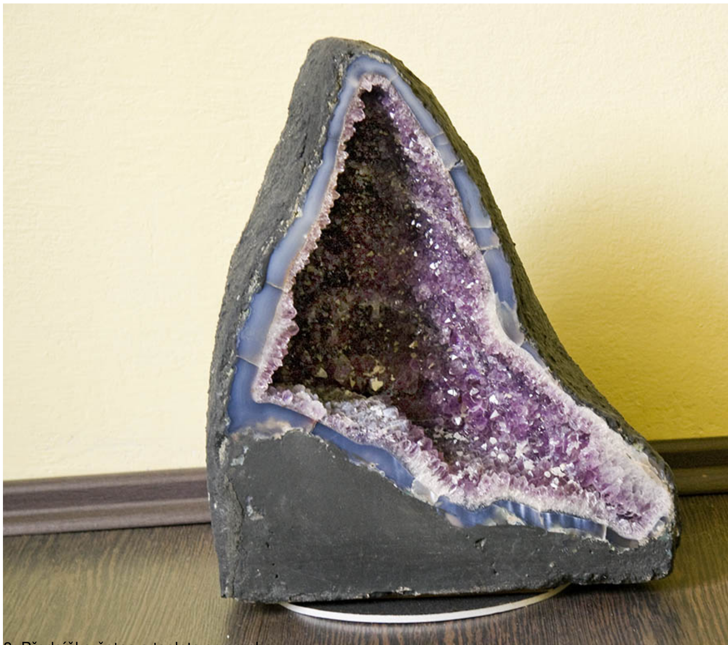
3. Předsíňka-šatna a toaleta se sprchou.